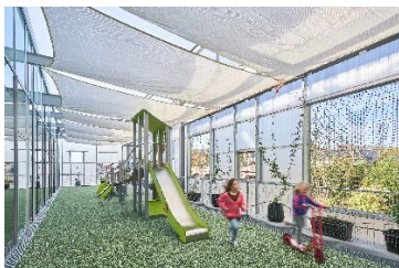
raumwerk.architekten, Hübert & Klußmann PartGmbH, Köln Gemischter Quartiersblock, Wuppertal