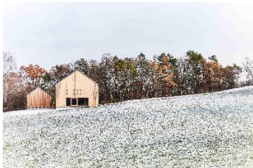
lohrmannarchitekten, Stuttgart Bildungszentrum, Weil der Stadt