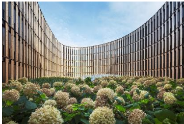
Christoph Ingenhoven Architects, Düsseldorf; ingenhoven associates GmbH, Düsseldorf Rathaus Freiburg im Breisgau

Pressebilder – honorarfrei für die einmalige, rein redaktionelle Nutzung im direkten Kontext und über die Dauer der Ausstellung ARCHITECTURE AND ENERGY unter Nennung des Urhebers