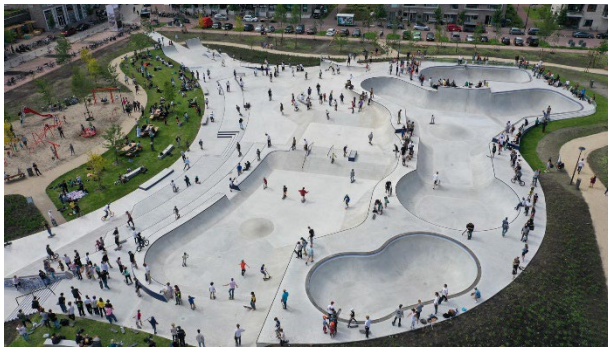
Sportheldenbuurt Urban Sport Zone, Amsterdam (NL) Design: Iris van der Helm (Municipality of Amsterdam); Kooperation: Glijberg / Lykke, Kopenhagen