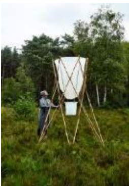
( Récouter ) la pluie, Clémence Althabegoity, 2016