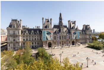
Fassadenbanner gestaltet von Shepard Fairey (Obey) und Begrünungen am Rathaus ( Hôtel du Ville ) Facade banners by Shepard Fairey (Obey) and greenery at City Hall ( Hôtel de Ville )