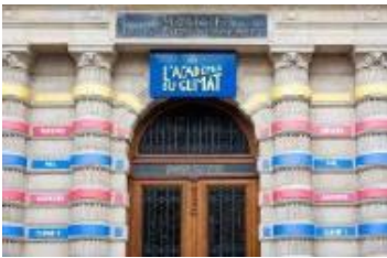
Einweihung der Klimaakademie , Paris, 2021 Inauguration of the Climate Academy , Paris, 2021