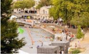
Badestelle Bras Marie , Paris, 2025 Bras Marie bathing area, Paris, 2025

Pressebilder – honorarfrei für die einmalige, rein redaktionelle Nutzung im direkten Kontext und über die Dauer der Ausstellung Too Hot unter Nennung des Urhebers